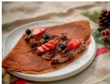
ブッシュ・ド・ノエルクレープ 1,100 円