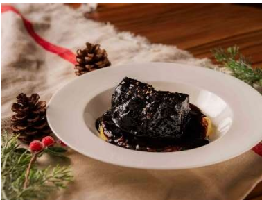
牛ホホ肉の赤ワイン煮込み 2,800 円

中央広場内の「麻布台ヒルズ キオスク」では、クリスマスの定番ブッシュ・ド・ノエルをイメージし「ブッシュ・ド・ノエルクレープ」や、フルーツとチョコレートの相性抜群な「チョコフォンデュ・カップケーキ」を展開。中央広場に面する「麻布台ヒルズカフェ」でも国産牛を使用した「牛ホホ肉の赤ワイン煮込み」などクリスマス限定メニューを販売します。