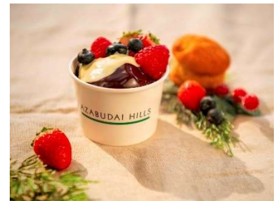
チョコフォンデュ・カップケーキ 700 円