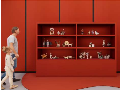
SELF@麻布台ヒルズ マーケット前